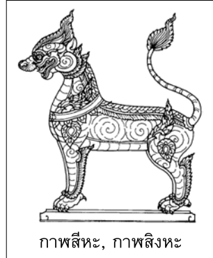
กาฬสีหะ, กาฬสิงหะ

กาฬสีหะ, กาฬสิงหะ : เรียกราชสีห์ชนิดหนึ่ง ร่างกายสีดำและใหญ่เท่าวัวหนุ่ม กินเนื้อเป็นอาหาร อยู่ในพวกสัตว์หิมพานต์ มีกล่าวถึงในเรื่อง มหาเวสสันดรชาดก มีรูปในสมุดภาพสัตว์หิมพานต์ที่เป็นแบบสำหรับผูกหุ้มให้เจ้านายนั่งอุ้มผ้าไตรไปในกระบวนแห่พระบรมศพ และเป็นภาพจิตรกรรมที่เขียนเป็นภาพป่าหิมพานต์