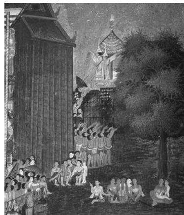
การทิ้งทานกัลปพฤกษ์

เพราะมีปรากฏอยู่ใน หมายเหตุ รับสั่ง พ.ศ. ๒๓๔๖ ครั้ง รัชกาลที่ ๑ ตอนหนึ่งว่า “แลให้เกณฑ์ผลมะกรูด ผล มะนาว ขุนหมื่น เข้าสัมทัง ทาน ตำรวจรักษาต้น กัลป- พฤกษ์ วันละ ๒ ต้น... แลผล มะกรูดมะนาวนั้นให้เกณฑ์